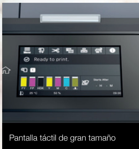
Pantalla táctil de gran tamaño