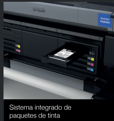
Sistema integrado de paquetes de tinta