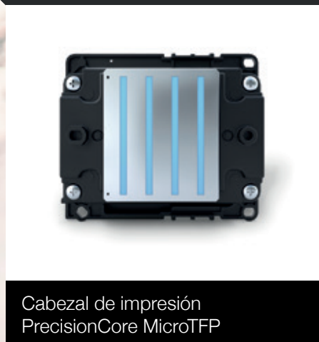
Cabezal de impresión PrecisionCore MicroTFP